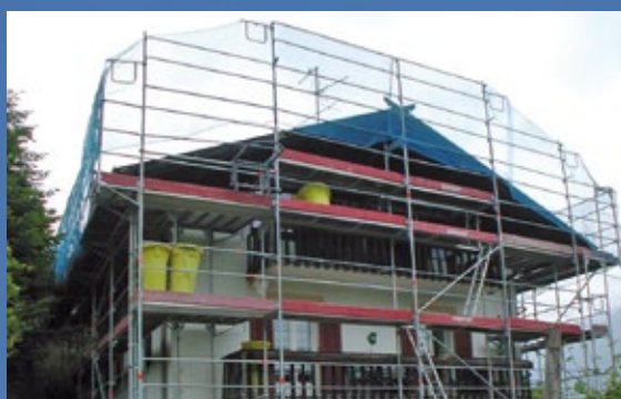
Ponteggi Layher in acciaio e alluminio, adattabili a ogni esigenza.