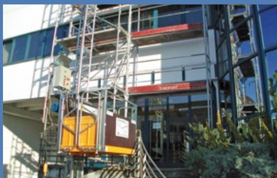
Piattaforme e montacarichi a cremagliera, reti di protezione, luci e cartellonistica di sicurezza e impianti d'allarme.